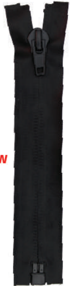
S10 OE RF AL P30 MA IPB ITS RESIN COATING