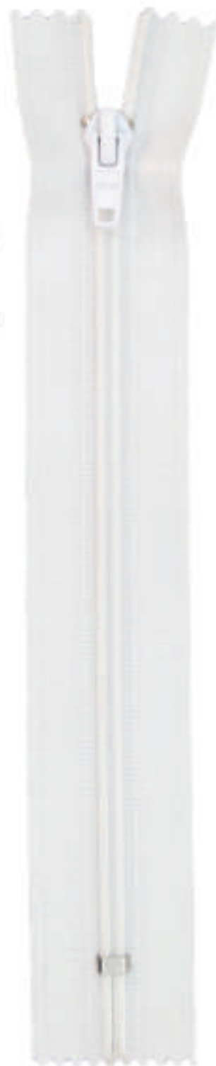
S6 CE AL P30 MA PVC