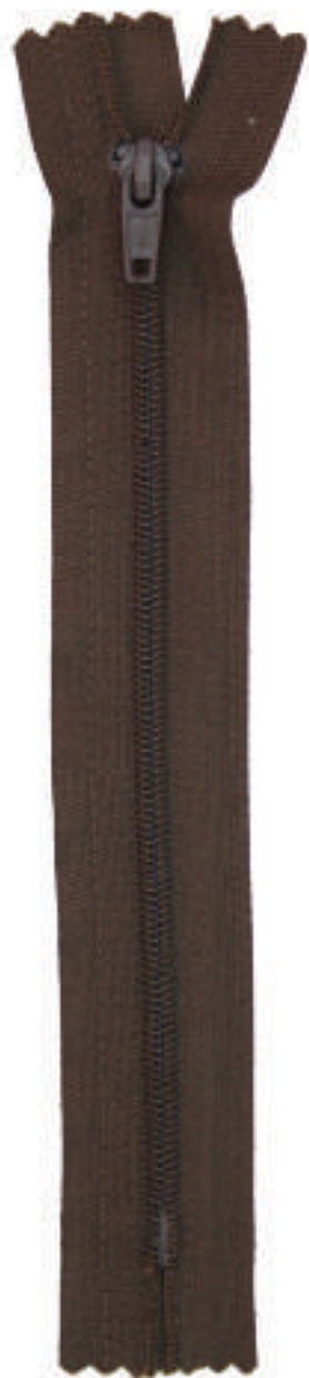
S5 CE AL P30 MA PT WTBS