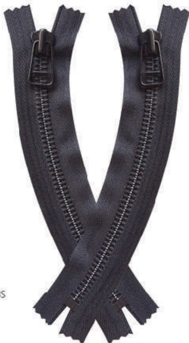
M8Y BO CE AL P724 BO CL