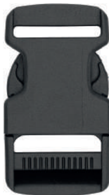
BOUCLES À DÉCLENCHEMENT LATÉRAUX S