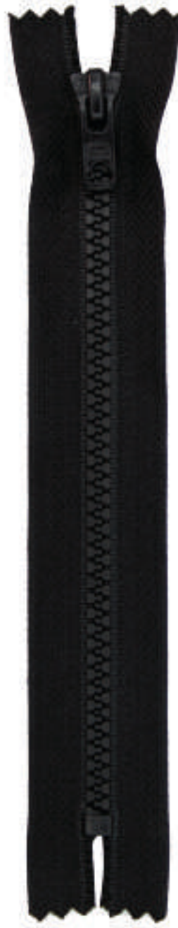
16 MA CE AL P84 MA FR