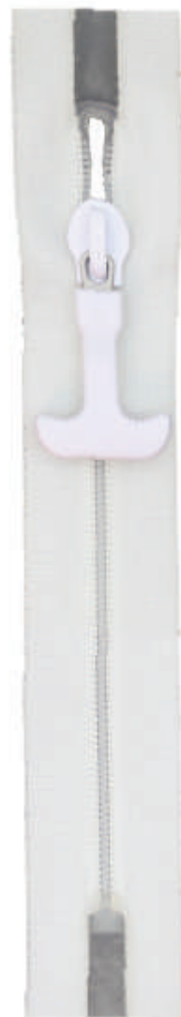
S8 CE NL P 2217 MA RUBAN PVC SOUDABLE HAUTE FREQUENCE