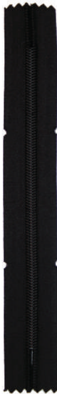
S6 CCG SPM AUTO FR