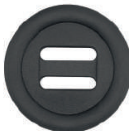
BOUTONS À COUDRE CANADIEN