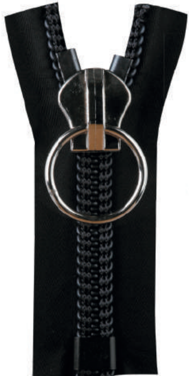
S19 CE NL P134 SF