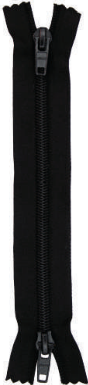
56 XC AL P30 MA AL P30 MA FR