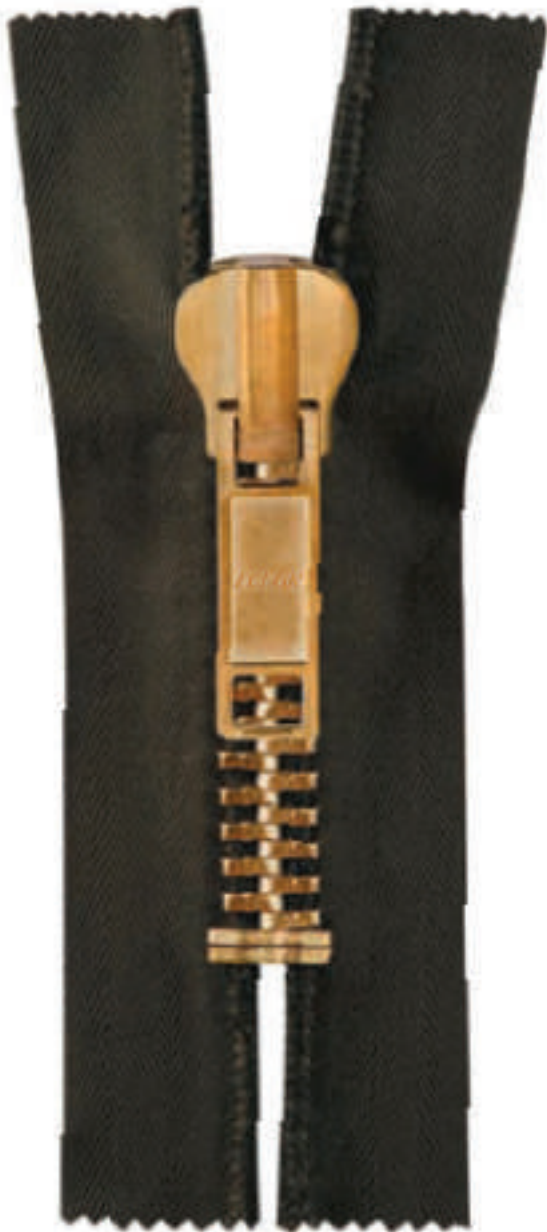
M14 B CE NL P785 B