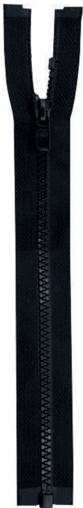
16 MA OE AL P84 MA QR