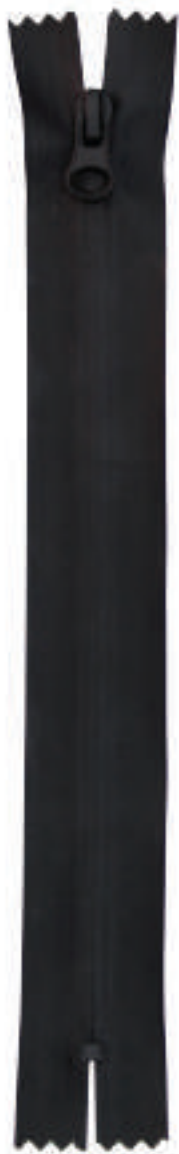
S4 CE RF AL P314 MA IBS ITS RESIN COATING