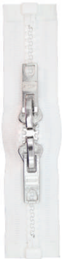
19 MA DOE AL DP84 SF AL DP84 SF MAILLES COMPTES