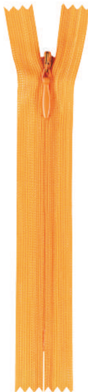
SC4 CE AL P39 MA KT