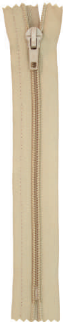
S6 CE AL P30 MA PT WBS