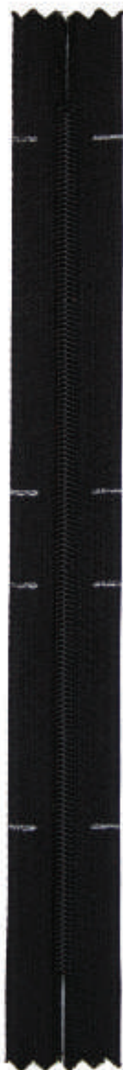
S4 CCG MM AUTO FR