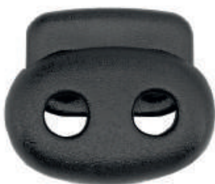
STOPPEUR CORDON A RESSORT DEUX TROUS