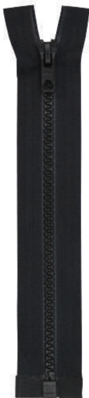
16 MA OE AL P84 MA MAILLES COMPTES