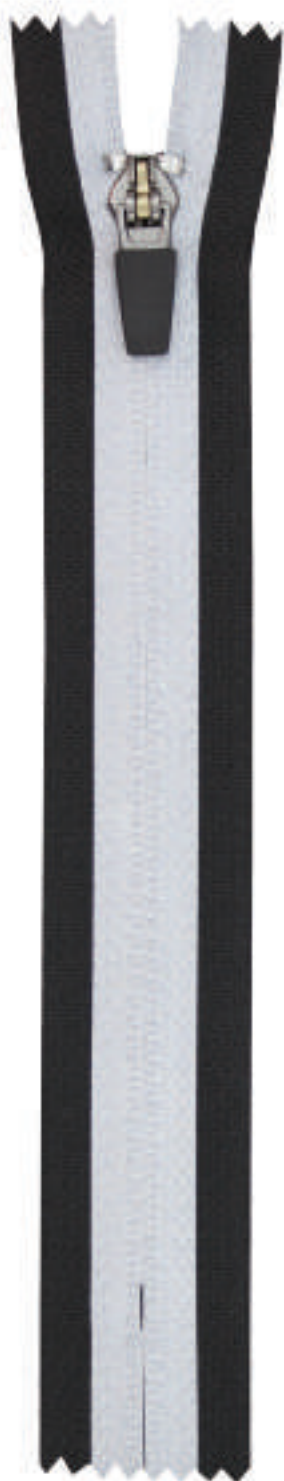
S6 CE RF AL P767 BO RT WBS