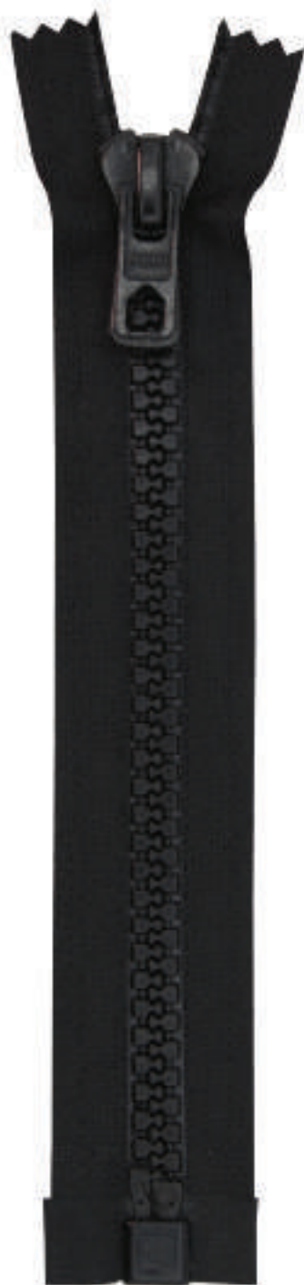
19 MA OE AL P56 MA MAILLES COMPTEES