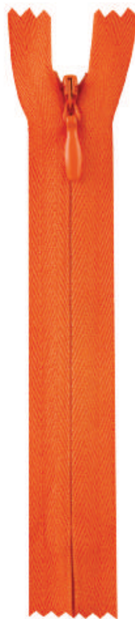
SC5 CE AL P39 MA WT