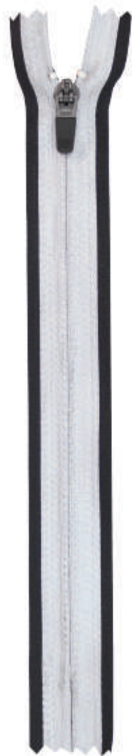
S4 CE RF AL P335 BO RT WBS