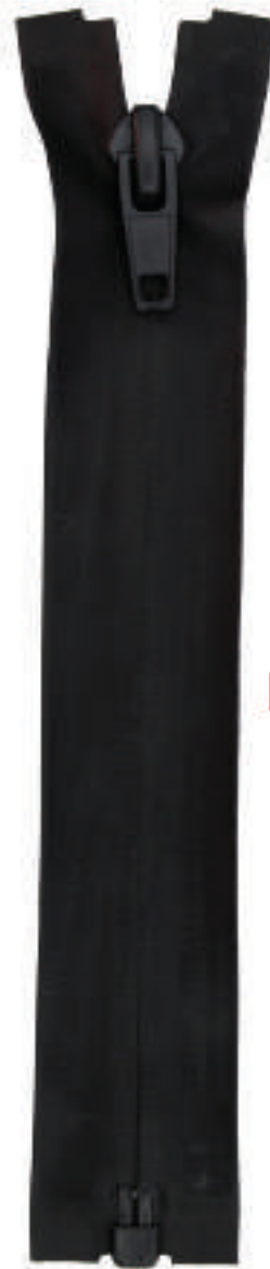
S7 OE RF AL P30 MA IPB ITS RESIN COATING