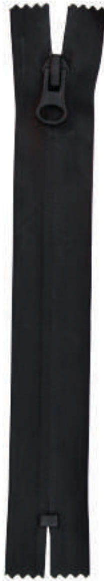
S6 CE RF AL P315 MA IBS ITS RESIN COATING