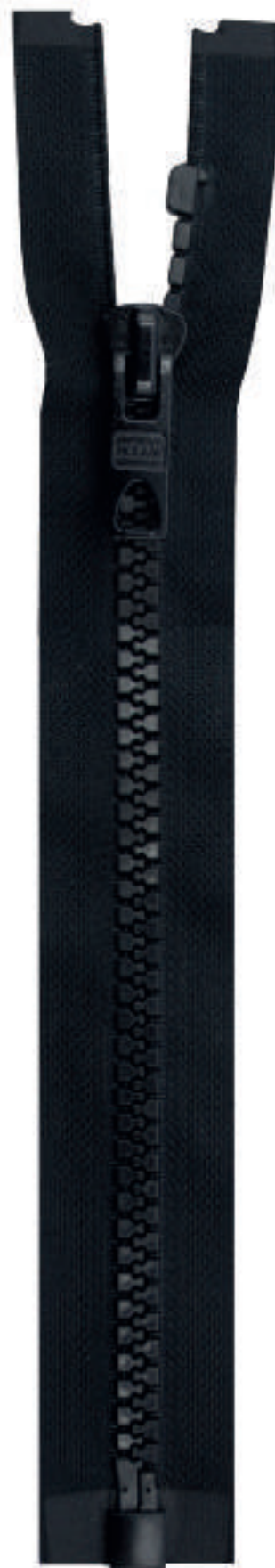
19 MA OE AL P84 MA QR