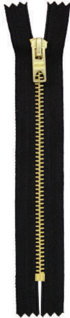
M6Y B CE AL P84 B FR