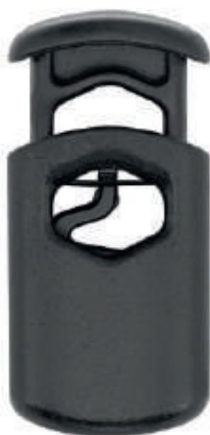
STOPPEUR CORDON A RESSORT